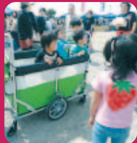
5/4・あわびフェアへ

新緑の季節となりました。かねてから建設中の企業内保育所「キッズアカデミーつばさ」が、5月1日オープンしました！(場所は特定施設わかばの南側)0歳から12歳までのスタッフの子供たちが対象です。子育て中でも、安心して働いてもらえる環境づくりをしていきます。