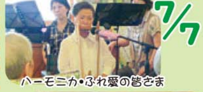
ハーマニカ・ぶれ愛の皆さま