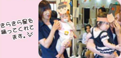
きらきら星を 踊ってくれて ます。