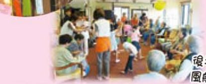
後半は、 風船バレーを 大盛り上がり！