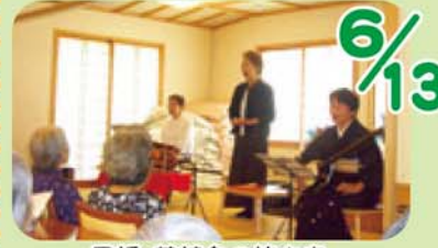
民謡・藤若会の皆さま