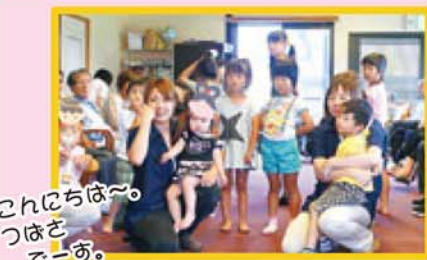
これにちは～ つばさ こーあ。