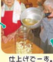
仕上げごーあ。 甘酢を入れま～す！