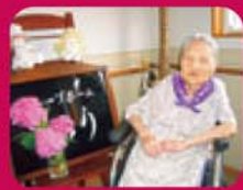
とっておきの笑顔・Part2 —きらり—

雨の日が多い七夕ですが、今年は晴天でした！天の川、見られましたか・・・？ ちょうど週末の七夕だったので、つばさの子どもたちがうららに遊びに来てくれました。 利用者さまと子どもたちで楽しい時間を過ごすことができました・・・。