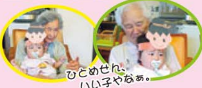
ひどめせん、 いい子やなあ。