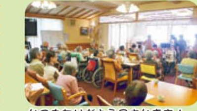
いつもありがとうございます！