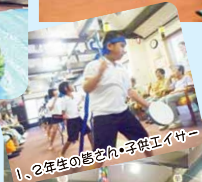
1、2年生の皆さん・子供エイサー