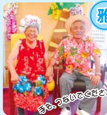
手を、つないでくださあ〜い!!