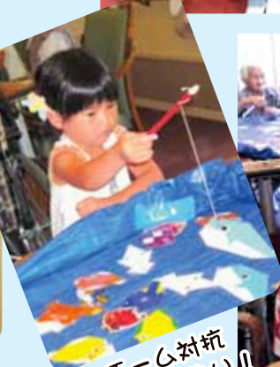
千〜ん対抗 さかな釣い!!