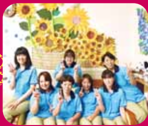
新しい制服で〜 〜きらり〜

暑さも一段落し、ようやく秋の気配を感じるようになりました。さて、ケアリゾートの各施設では恒例の夏祭りを開催！どの施設も夏休み中の子どもたちが踊りの披露してくれたり、おやつを配ったりしてお手伝いをしてくださいました。利用者さま方もとても喜ばれていました。^^