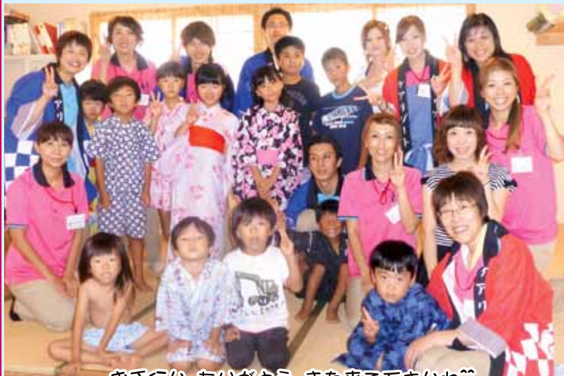
お手伝い、ありがとう。また来て下さいね^^