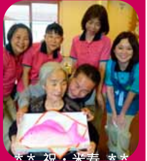
*** 祝・米寿 ***

ひと雨降っても寒かったり、急に初夏みたいになったりとお天気的气まぐれに振り回されますね。泣いても笑ってもお天道様にはかないません…。ポチポチやっていくしかありませんね。さて今回は、3月8～10日まで開催された、こころサンキュウの日特集です！^^